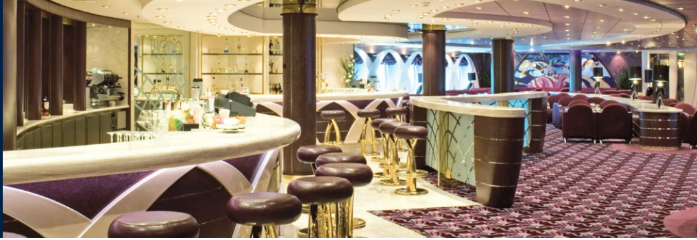
IL TUCANO LOUNGE