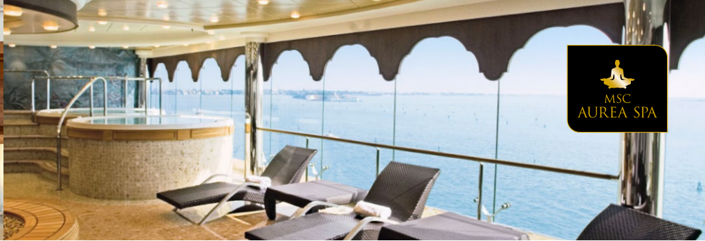
MSC AUREA SPA